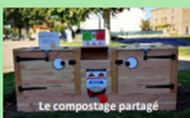
Le compostage partagé

Afin que la pratique du compostage soit accessible à tous, le S.I.C.T.O.M. équipe les communes en composteurs partagés. Au 31 octobre 2022, plus de 400 composteurs partagés sont installés sur le territoire du S.I.C.T.O.M. ! Vous pouvez vous rapprocher du S.I.C.T.O.M. ISSOIRE-BRIOUDE et de votre Mairie pour lancer cette opération dans votre quartier !