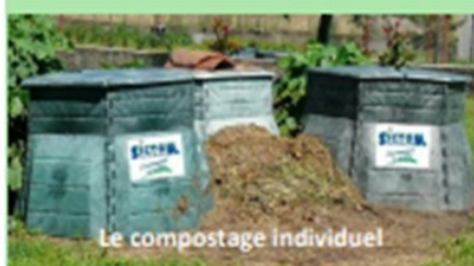
Le compostage individuel

Le S.I.C.T.O.M. propose aux usagers, depuis de nombreuses années, d'acquiescer des composteurs individuels. Si l'acquisition d'un composteur individuel vous intéresse, nous vous invitons à remplir et à nous retourner un bon de commande (disponible sur notre site internet).